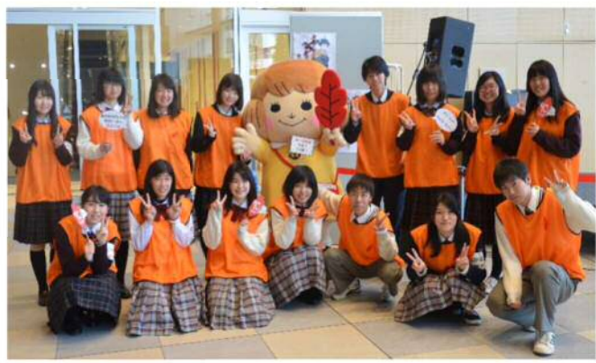
↑ 第1回 あかし赤い羽根共同募金フェア開催時 「あかはねちゃんサポーター」のみなさん

赤い羽根共同募金運動 は、昭和 22 年(1947 年)、戦争の打撃を受けた社会福祉施設や団体を、民間の立場から支える運動として始まりました。みなさまからいただいた募金は、地域の方が気軽に集える居場所づくりの支援や、私立保育園の遊具などの整備支援など、明石市内で実施される様々な活動に役立っています。