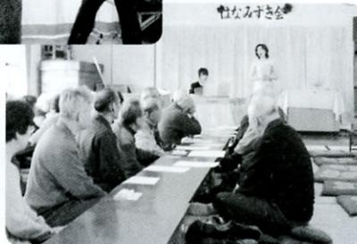
みんなで歌を楽しく