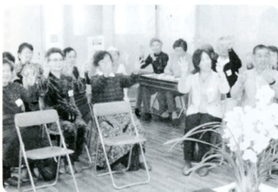
レクリエーション (ゲーム、マジックショー)

現在、ミニケア・ふれあいサロンは、市内全域で62箇所が実施されています。(社協届出分)