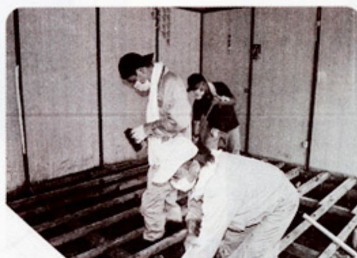
平成21年夏の兵庫県西・北部豪雨災害での被災地への支援活動