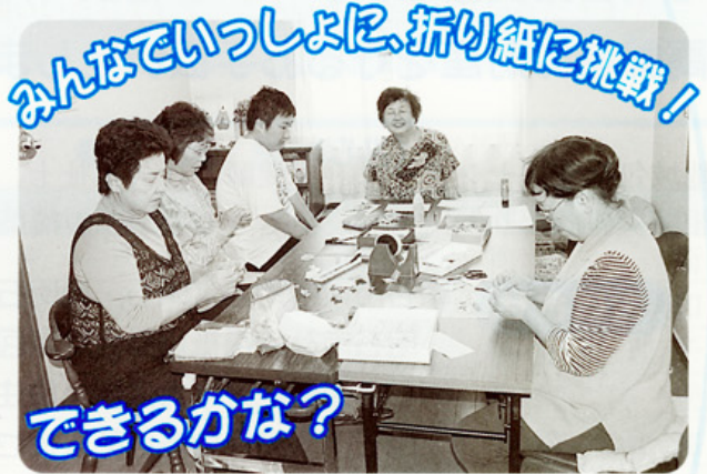
みんなていっしょに、折り紙に挑戦！