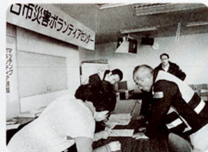
平成22年1月17日の災害ボランティアセンター設置訓練