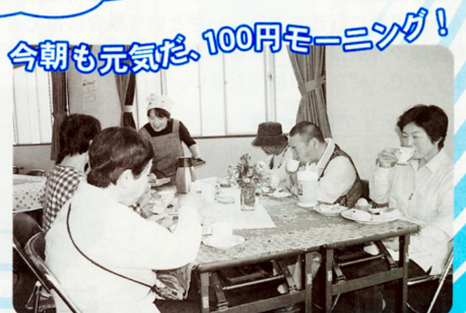
今朝も元気だ、100円モーニング！