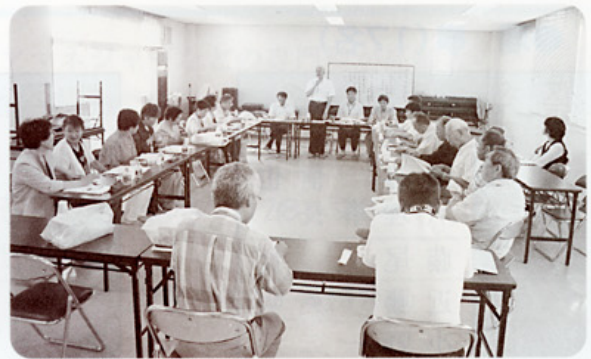
大久保北地区社会福祉協議会