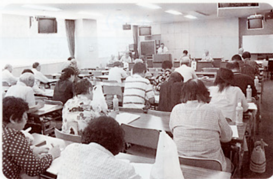
望海地区社会福祉協議会