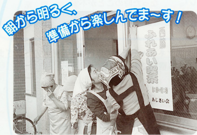
朝から明るく、準備から楽しんでま〜す！

サロン開設にご協力いただける方は、明石市社会福祉協議会までお問い合わせください。