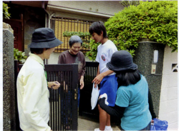
お元気ですか〜？ また来ます