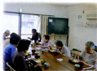
ふれあい会食のようす