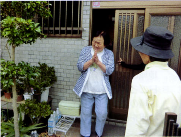
また来てくれたん、うれしいわあ！