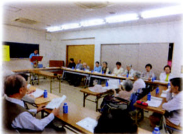
サロン(サクソ演奏)