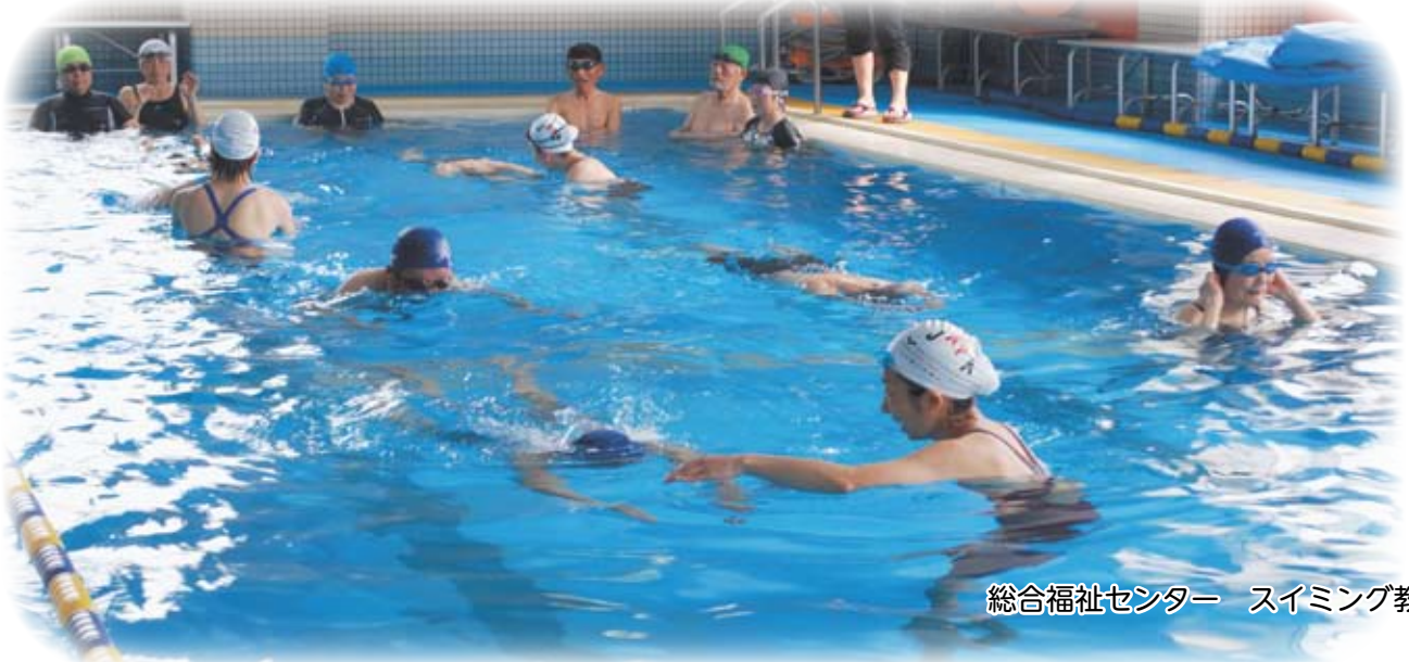
総合福祉センター スイミング教室