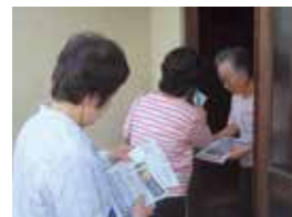
ふれあい訪問の様子

地域で安否確認が必要な方を定期的に地域のボランティアが訪問し、対話や交流等を通じて孤独感の解消を図る活動に活用しました。