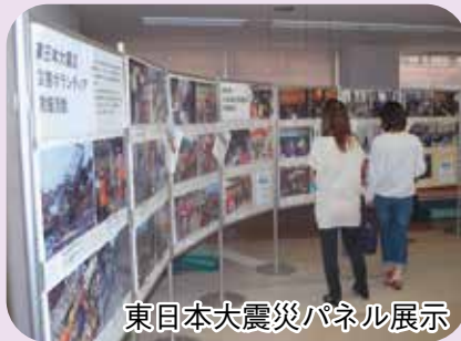
東日本大震災パネル展示