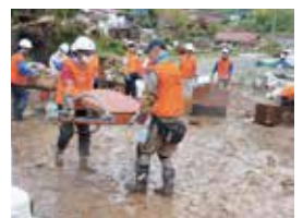
気仙沼市での支援活動