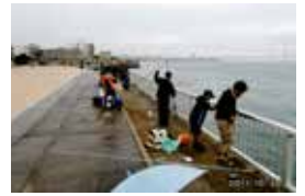
親子釣り大会の様子

子ども会による親子釣り大会への助成や「子どもが安心して遊べる環境づくり」の研修会に助成しました。