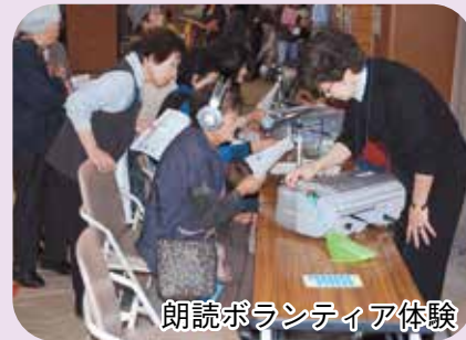
朗読ボランティア体験