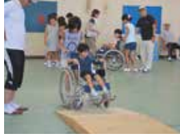
福祉スクールの様子