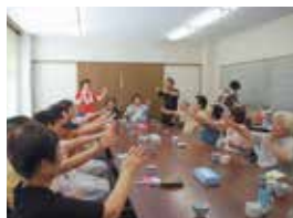
ふれあいサロンの様子

住民が住み慣れた地域で歩いて行ける居場所や憩いの場となるミニケア・ふれあいサロンを応援しました。