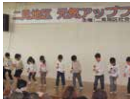
地区社協啓発事業

市内の地区社会福祉協議会の地域福祉活動（福祉啓発事業、高齢者のつどい、子育て支援など）を推進するため助成しました。