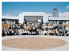
障がい者団体の交流事業

身体障がい者や視覚障がい者などの相互の親睦を深めるため、交流行事などに助成しました。