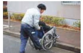
外出応援ボランティア養成講座