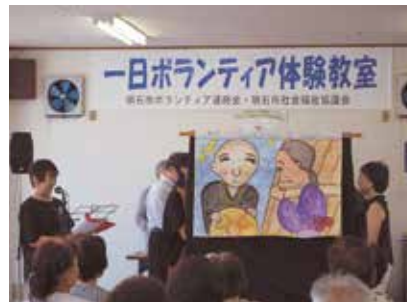
朗読劇・発声朗読体験