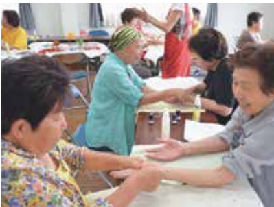
アロマセラピー体験