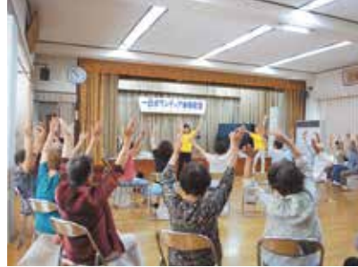
レクリエーション体験