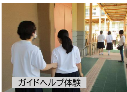
ガイドヘルプ体験