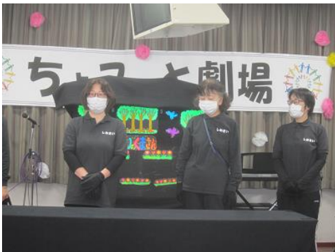
ブラックパネルシアター