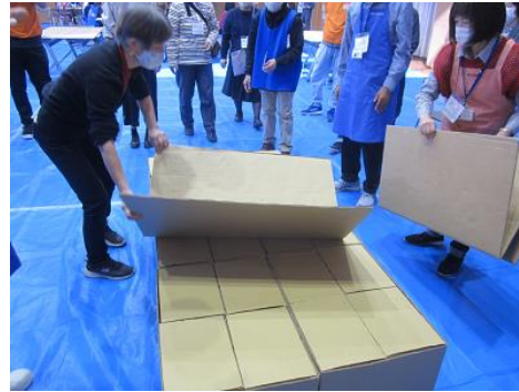
ダンボールベッドの組立