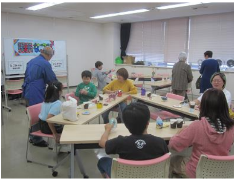
コーヒー・ジュース (お菓子付き)