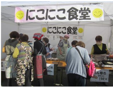
炊き込みご飯・あん巻・お寿司