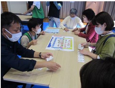
防災ボードゲーム