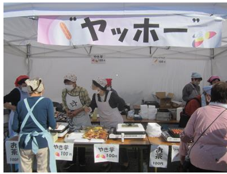
フランクフルト・焼いも