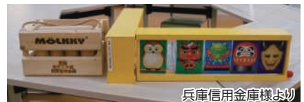
兵庫信用金庫様より