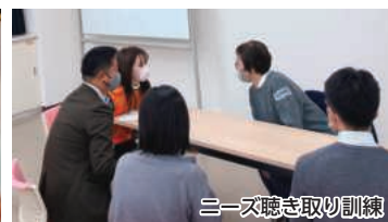
ニーズ聴き取り訓練