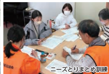
ニーズとりまとめ訓練