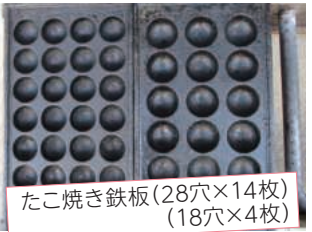
たこ焼き鉄板(28穴×14枚) (18穴×4枚)