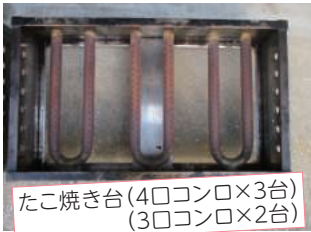
たこ焼き台(4口コンロ×3台) (3口コンロ×2台)