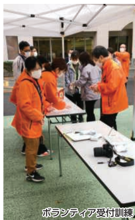
ボランティア受付訓練