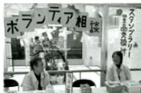
ボランティアフェスタでの相談の様子